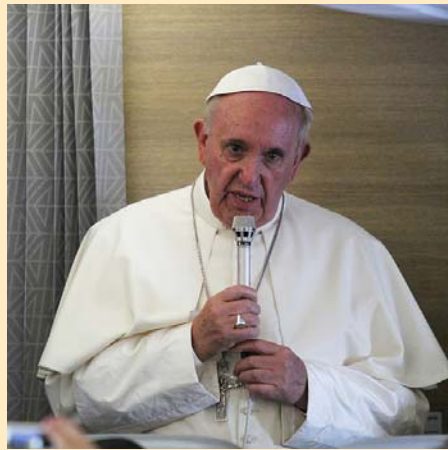
ദൈവപിതാവിന്റെ ദാനമാണ് മാർപാപ്പ ചൂണ്ടിക്കാട്ടി. കരുണാർദ്രമായ സ്നേഹം

യുവജനങ്ങളാണ് സഭയുടെ പ്രതീക്ഷയെന്ന് ഫ്രാൻസിസ് മാർപാപ്പ. പോളണ്ടിലെ ക്രാക്കോവിൽ നടന്ന ലോകയുവജനസമ്മേളനത്തെ അഭിസംബോധന ചെയ്തു പ്രസംഗിക്കുകയായിരുന്നു മാർപാപ്പ. യുവജനങ്ങളെ സഭ ഉറ്റുനോക്കുകയാണ്. മാറ്റങ്ങൾ വരുത്താൻ നമുക്കുകഴിയുമോ? നമുക്കെല്ലാവർക്കും ഒന്നിച്ചു കരുണയെക്കുറിച്ച് സംസാരിക്കാം. കരുണയ്ക്കായി ഹൃദയങ്ങൾ തുറക്കണം. ശൂന്യമായ ആഘോഷങ്ങളെക്കുറിച്ചാണോ നിങ്ങൾ ചിന്തിക്കുന്നത്. പരിശ്രമംകൂടാതെ പരാജയം സമ്മതിച്ചു പിന്മാറുന്ന യുവത്വം എന്നെ വേദനിപ്പിക്കുന്നു. യേശുക്രിസ്തുവിനെ വില കൊടുത്തു വാങ്ങാൻ കിട്ടുന്നതല്ല. അവൻ